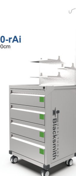
CM-605090-rAi Medidas: 60x50x90cm Peso: 40kg