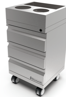
CM-605090-TAi Medidas: 40x40x70cm Peso: 32kg