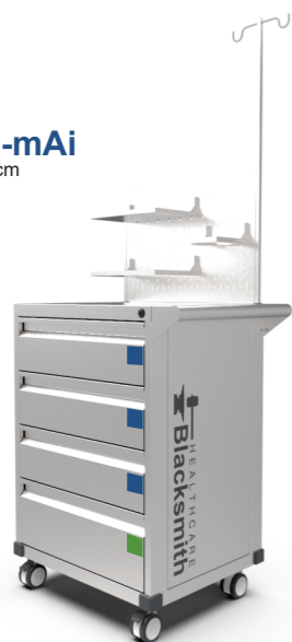
CM-605090-mAi Medidas: 60x50x90cm Peso: 40kg