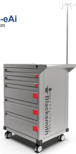
CM-605090-eAi Medidas: 60x50x90cm Peso: 40kg